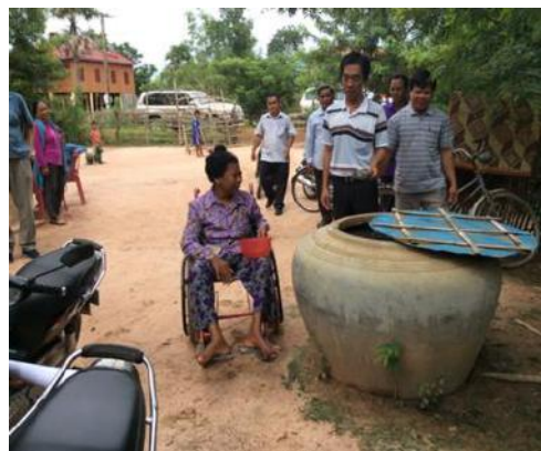
រូបភាពទី៣ ៖ ជនពិការម្នាក់កំពុង ប្រើប្រាស់ ពាងទឹក នៅឯផ្ទះរបស់គាត់ក្នុងខេត្តព្រៃវែង

ក្រសួងអភិវឌ្ឍន៍ជនបទ មន្ទីរអភិវឌ្ឍន៍ជនបទខេត្តព្រៃវែង និង អង្គការជនពិការ បានធ្វើ តេស្តសាកល្បងទៅលើការជម្រុញអនុវត្តន៍ CLTS ជាមួយមនុស្សពេញវ័យនិងកុមារក្នុង ខេត្តព្រៃវែង។ លទ្ធផលមន្ទីរអភិវឌ្ឍន៍ជនបទខេត្តព្រៃវែង បានតភ្ជាប់ទំនាក់ទំនងជាមួយ អង្គការជនពិការ ព្រមទាំងបានចែករំលែកបទពិសោធន៍អំពីចាប់ដៃគូជាមួយអង្គការ