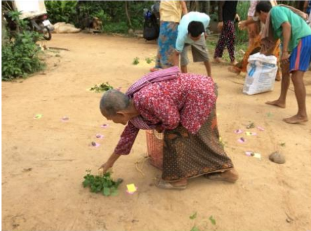
រូបភាពទី៤ ៖ ស្ត្រីចំណាស់ម្នាក់កំពុងដាក់រូបតំណាងលាមក នៅលើ "ផែនទីភូមិ" ក្នុងទីតាំងដែលគាត់បន្ទោបង់រាល់ថ្ងៃ ខេត្តកំពង់ចាម

មិនមែនរដ្ឋាភិបាលដែលធ្វើការងារលើផ្នែកផ្គត់ផ្គង់ទឹកស្អាត និងលើកកម្ពស់អនាម័យនិងមន្ទីរអភិវឌ្ឍន៍ជនបទដទៃទៀតដើម្បីបញ្ចូលជនពិការទៅក្នុងការជម្រុញអនុវត្តន៍ CLTS ។ (សូមមើលរូបភាពទី៤)