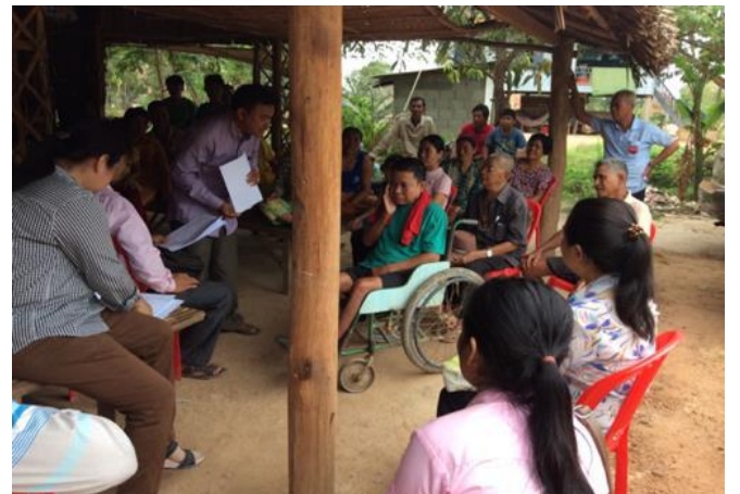
រូបភាពទី៨ ៖ មន្ទីរអភិវឌ្ឍន៍ជនបទខេត្តកំពត កំពុងសម្ភាសន៍បុរសពិការម្នាក់ដែលប្រើប្រាស់ទេះរុញខេត្តកំពត

អង្គការ SNV មន្ទីរអភិវឌ្ឍន៍ជនបទ ខេត្តកំពត និងអង្គការជនពិការបានធ្វើតេស្តទៅលើការពិនិត្យតាមដានសកម្មភាពបញ្ឈប់ការបន្ទាបបង់ពាសវាលពាសកាល ((ODF)) ក្នុងខេត្តកំពត។ គោលបំណងគឺដើម្បីធានាឲ្យមានការដាក់បញ្ចូលជនពិការទៅក្នុងដំណើរការពិនិត្យផ្ទៀងផ្ទាត់របស់ការពិនិត្យតាមដានសកម្មភាពបញ្ឈប់ការបន្ទាបបង់ពាសវាលពាសកាល (ODF) តាមរយៈកិច្ចសម្ភាសន៍ជនពិការនិងការធានាថាពួកគេប្រើប្រាស់បង្គន់ដែលមានអនាម័យ។