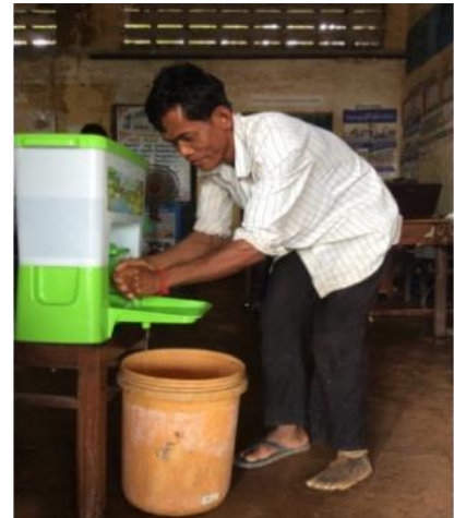
រូបភាពទី៥ ៖ បុរសពិការជើងម្នាក់កំពុងអនុវត្តន៍លាងដៃ ខេត្តស្ទឹងត្រែង

ដោយមានកិច្ចសហការជាមួយ Samaritan's Purse និង អង្គការជនពិការ គេបានផ្ញើសារជូនដើម្បីធានាថា អ្នកដែលមានបញ្ហាកំសោយអវៈយៈផ្សេងៗគ្នា ជាពិសេសអ្នកដែលមានបញ្ហាកំសោយផ្នែកសោតវិញ្ញាណ និង ចក្ខុវិញ្ញាណ អាចមានលទ្ធភាពទទួលបានព័ត៌មាននានា។ (សូមមើលរូបភាពទី៥)