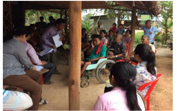
រូបភាពទី៧ ៖ ការប្រើប្រាស់ឧបករណ៍ជម្រុញការអនុវត្តន៍ជាមួយសហគមន៍ និងជនពិការ ក្នុងខេត្តព្រៃវែង

អង្គការ SNV មន្ទីរអភិវឌ្ឍន៍ជនបទ ខេត្តកំពត និងអង្គការជនពិការបានធ្វើតេស្តទៅលើការពិនិត្យតាមដានសកម្មភាពបញ្ឈប់ការបន្ទាបបង់ពាសវាលពាសកាល ((ODF)) ក្នុងខេត្តកំពត។ គោលបំណងគឺដើម្បីធានាឲ្យមានការដាក់បញ្ចូលជនពិការទៅក្នុងដំណើរការពិនិត្យផ្ទៀងផ្ទាត់របស់ការពិនិត្យតាមដានសកម្មភាពបញ្ឈប់ការបន្ទាបបង់ពាសវាលពាសកាល (ODF) តាមរយៈកិច្ចសម្ភាសន៍ជនពិការនិងការធានាថាពួកគេប្រើប្រាស់បង្គន់ដែលមានអនាម័យ។