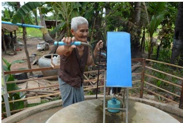
រូបភាពទី២ ៖ ស្ត្រីចំណាស់ម្នាក់កំពុងប្រើប្រាស់ ហេដ្ឋារចនាសម្ព័ន្ធផ្គត់ផ្គង់ទឹកក្នុងខេត្តសៀមរាប