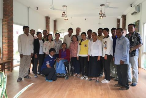
រូបភាពទី១០ ៖ ការថតរូបជាក្រុមនៅកិច្ចប្រជុំពិគ្រោះយោបល់ ក្នុងខេត្តបាត់ដំបង

ពិចារណាឲ្យបានល្អិតល្អន់ឡើយ។ ដូច្នោះអង្គការ WaterAid បានសហការជាមួយអង្គការ HelpAge រៀបចំឲ្យមានកិច្ចប្រជុំពិគ្រោះយោបល់មួយជាមួយសមាគមមនុស្សចាស់ (OPAs) បានបង្កើតនូវកិច្ចប្រជុំពិគ្រោះយោបល់មួយជាមួយសមាគមមនុស្សចាស់ (OPAs) ក្នុងខេត្តបាត់ដំបងដើម្បីទទួលបានធាតុចូលរបស់ពួកគេទៅក្នុងគោលការណ៍ណែនាំនេះ សំដៅធានាឲ្យមានការគិតគូរពិចារណា និងដោះស្រាយសេចក្តីត្រូវការនិងបញ្ហារបស់ពួកគេ។