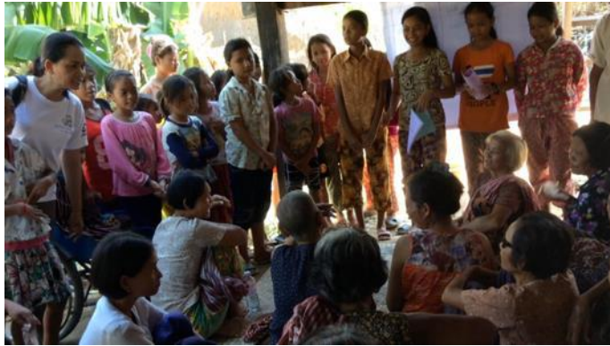
រូបភាពទី៦ ៖ ក្រោយពេលជម្រុញការអនុវត្តន៍ កុមារបានសុំឲ្យឪពុកម្តាយរបស់ពួកគេសង់បង្គន់នៅឆ្នះ ខេត្តព្រៃវែង

ធ្វើការផ្សព្វផ្សាយជូនដល់ជនពិការនៅក្នុងសហគមន៍អំពីអន្តរាងទឹកដែលបង្កលក្ខណៈឲ្យពួកគេអាចមានលទ្ធភាពប្រើប្រាស់បាន។ (សូមមើលរូបភាពទី៦ និងទី៧)