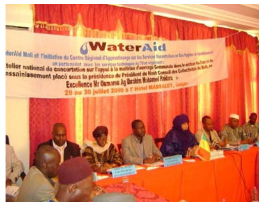
Cérémonie d'ouverture de l'atelier