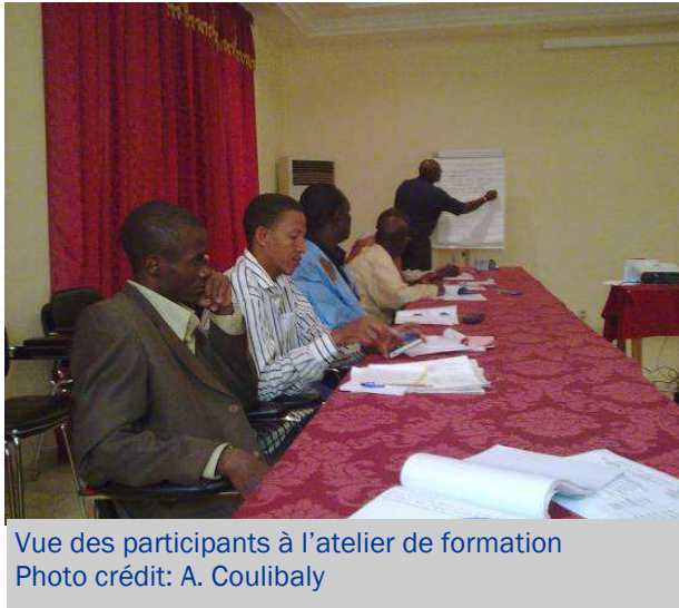
Vue des participants à l'atelier de formation

Les organisations de la société civile travaillant dans le secteur de l'eau, assainissement et d'hygiène, ont été formées en analyse des politiques et suivi budgétaire par un pool d'acteurs formé au Burkina sur une initiative de WaterAid globale.