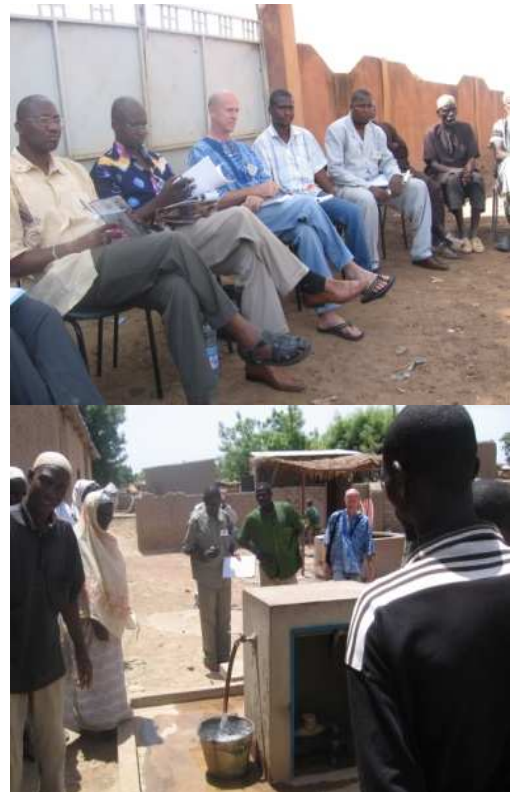
Images prises lors de la visite

Pour plus d'information, veuillez contacter Nicolas Sidibé, Coordinateur du Centre Régional d'Apprentissage des Services Décentralisés de l'eau et de l'Assainissement. Email : nicolassidibe@wateraid.org