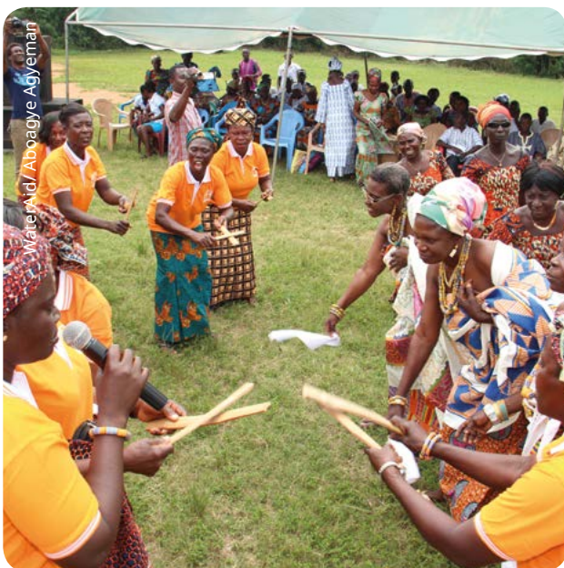
Mujeres del grupo ABIGAIL bailan para celebrar la entrega de una instalación de agua limitada.